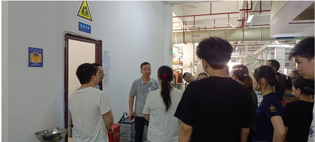
危废室注意事项讲解