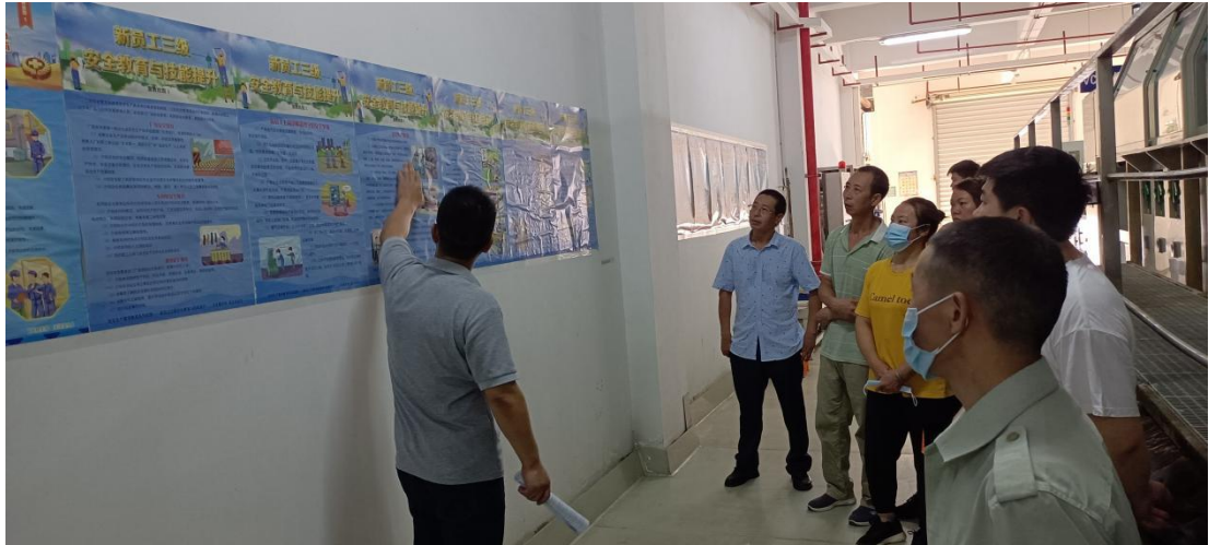
危废相关知识讲解